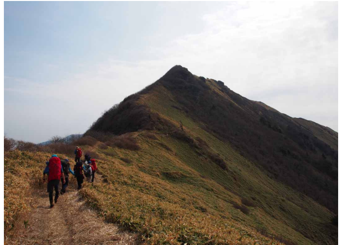
▲ちち山と笹原縦走路