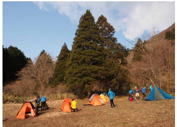
▲笹ヶ峰のテント場